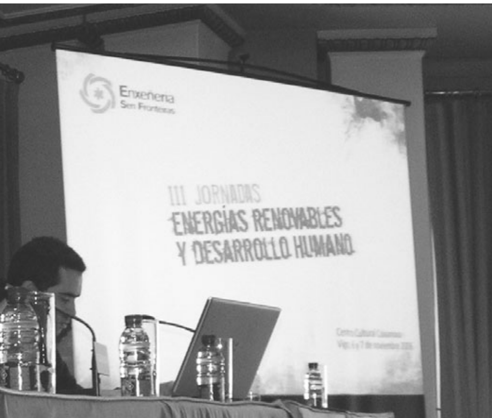
ante la inauguración de las Jornadas.