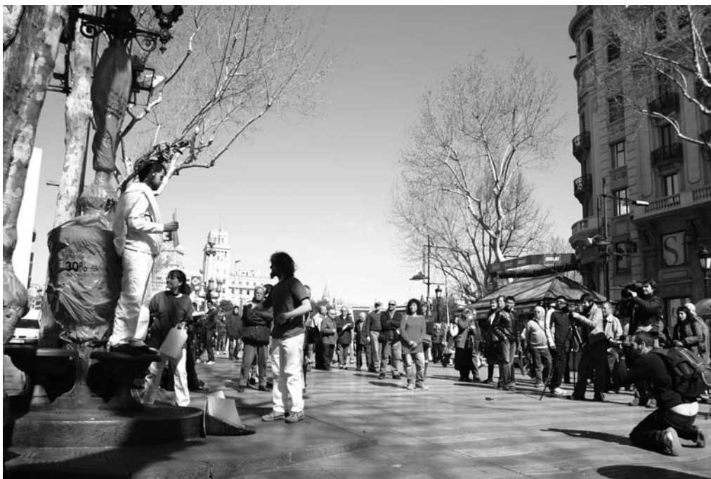
Lectura del Manifiesto de ISF en Barcelona, el Día Mundial del Agua.

ISF Cataluña trabaja en diversas redes internacionales para construir alternativas hacia un modelo público eficaz con participación y control social, como herramienta básica para garantizar el ac-