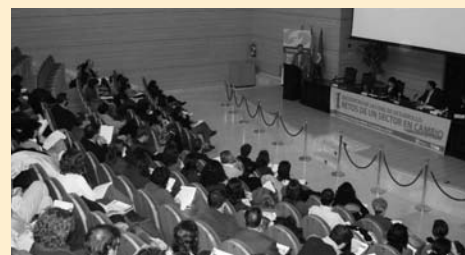
I Encuentro de ONGD de España.

El pasado mes de febrero tuvo lugar el I Encuentro de ONG de Desarrollo que ha organizado la Coordinadora de ONG de Desarrollo (CONGDE). Más de 250 profesionales de ONGD participaron en esta cita, titulada Retos de un sector en cambio . Junto a ellos, expertos en Cooperación al Desarrollo, académicos, periodistas y otros profesionales reflexionaron sobre algunos temas cruciales para el sector, como la necesidad de impulsar la calidad, la transparencia y las mejoras en el ámbito de los recursos humanos. La Secretaria de Estado de Cooperación Internacional, Leire Pajín, felicitó a la CONGDE por esta iniciativa.