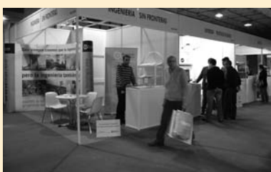
Stand de ISF en la Feria de Climatización 2007. IFEMA. Madrid.

ISF Asociación para el Desarrollo contó con un stand en Climatización 2007, que tuvo lugar en Feria de Madrid del 28 de febrero al 3 de marzo. Organizada por IFEMA, la muestra es el principal referente europeo del sector, uno de los que más se verá favorecido en el futuro por el progresivo avance de las energías renovables en éste ámbito. Es la segunda vez que Climatización-IFEMA cede un stand a ISF ApD para estar presente en su feria.