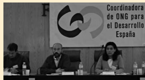
Asamblea de la CONGDE el pasado 24 de marzo.