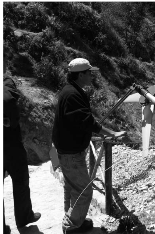
Centro de Demostración y Capacitación en Energías Renovables. Perú. F

A su vez, los PCR son para ISF una oportunidad para nutrirse de personal cualificado y motivado por la cooperación internacional y la tecnología para el desarrollo humano. La experiencia cercana a la realidad del Sur establece un entorno de integración