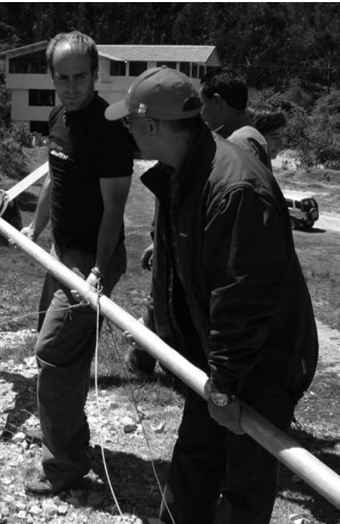
Programa PCR 2006.

ello, los interesados se convierten en preseleccionados que se pondrán a disposición de los equipos de trabajo del proyecto en concreto para el que han sido asignados.