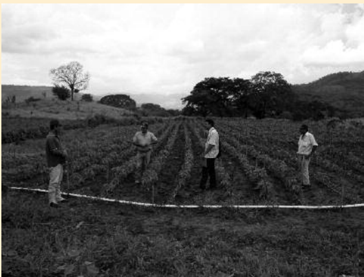
Proyecto de desarrollo de ISF ApD en Nicaragua.

La experiencia de ISF Galicia es fundamental en los Seminarios de Formación. Ejemplo de ello lo constituyen los cursos de calidad de agua e hidrogeología que se llevan a cabo, donde el conocimiento técnico y su participación es un pilar básico del proyecto. A ello se suman en 2008 diversos cursos de capacitación al personal saharai en el uso de software relacionado con la explotación de los recursos hí-