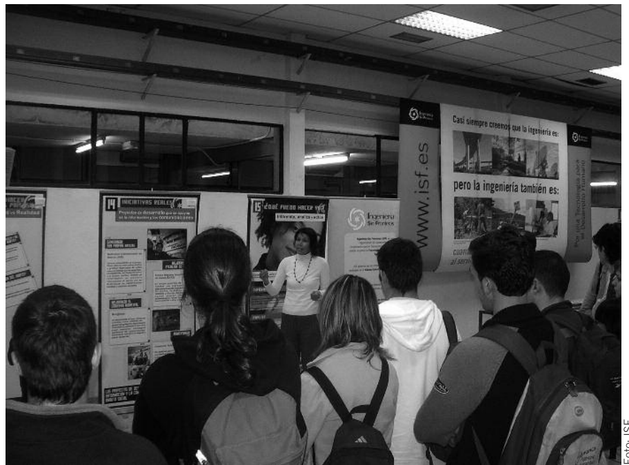
Exposición sobre TIC y Desarrollo. Escuela Universitaria de Informática. Campus Sur. UPM. Madrid.

La universidad ya se ha dado cuenta, por un lado, del poder del voluntariado para promover el cambio social y, por otro, del importante papel que esta institución puede desempeñar en la lucha