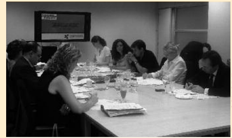
Reunión de la Comisión de Seguimiento del Pacto de Estado contra la Pobreza el 18 de junio.

El 18 de junio se celebró la segunda reunión de la Comisión de Seguimiento del Pacto de Estado contra la Pobreza, firmado el 19 de diciembre de 2007 por todos los partidos políticos con representación parlamentaria. Con la incorporación de Unión del Pueblo Navarro, la Comisión se ha reunido para analizar el grado de cumplimiento del Pacto en un contexto económico "poco favorable". Los principales retos pendientes del Pacto son los presupuestos generales, la reforma de los Fondos de Ayuda al Desarrollo (FAD) y una mayor coherencia de políticas. La Coordinadora ONGD España ha señalado que también sería importante avanzar en cuestiones como la deducción de las contribuciones de personas físicas a las ONGD, así como en el avance de la reforma del Estatuto del Cooperante, propuestas ambas recogidas en el texto del pacto. www.congde.org .