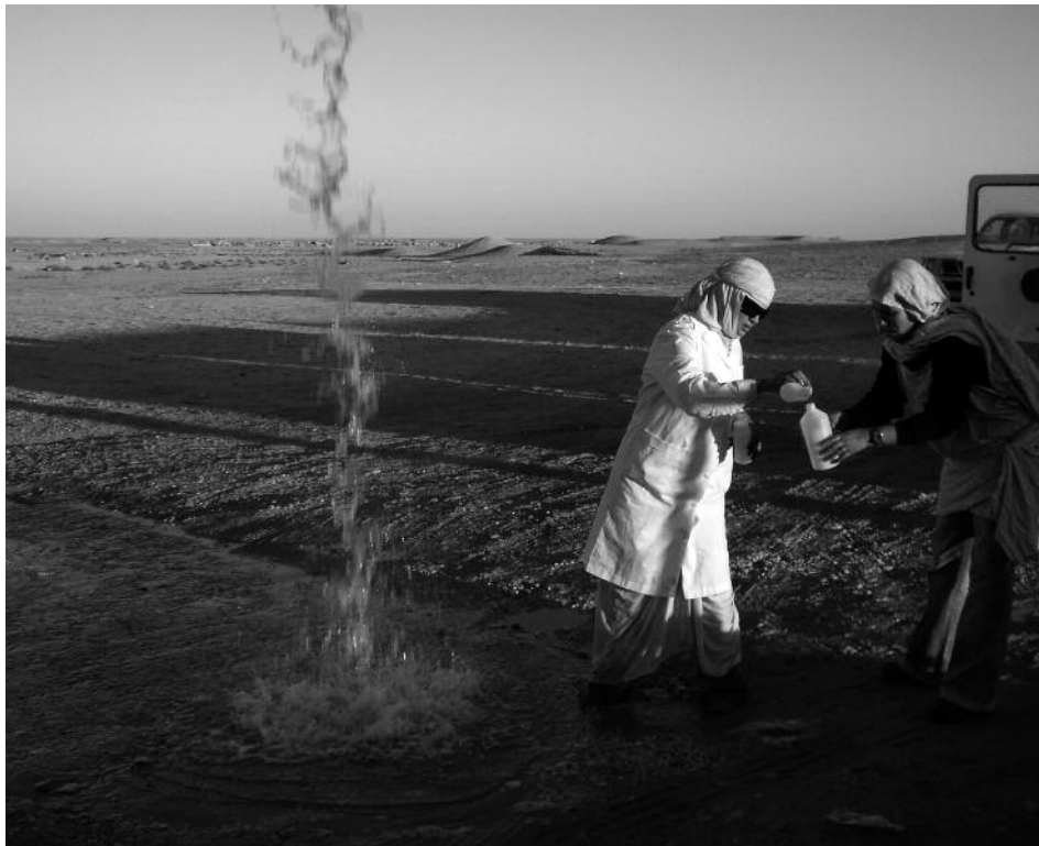
Mujeres del Departamento de Hidráulica Saharai toman muestras de agua de un pozo.